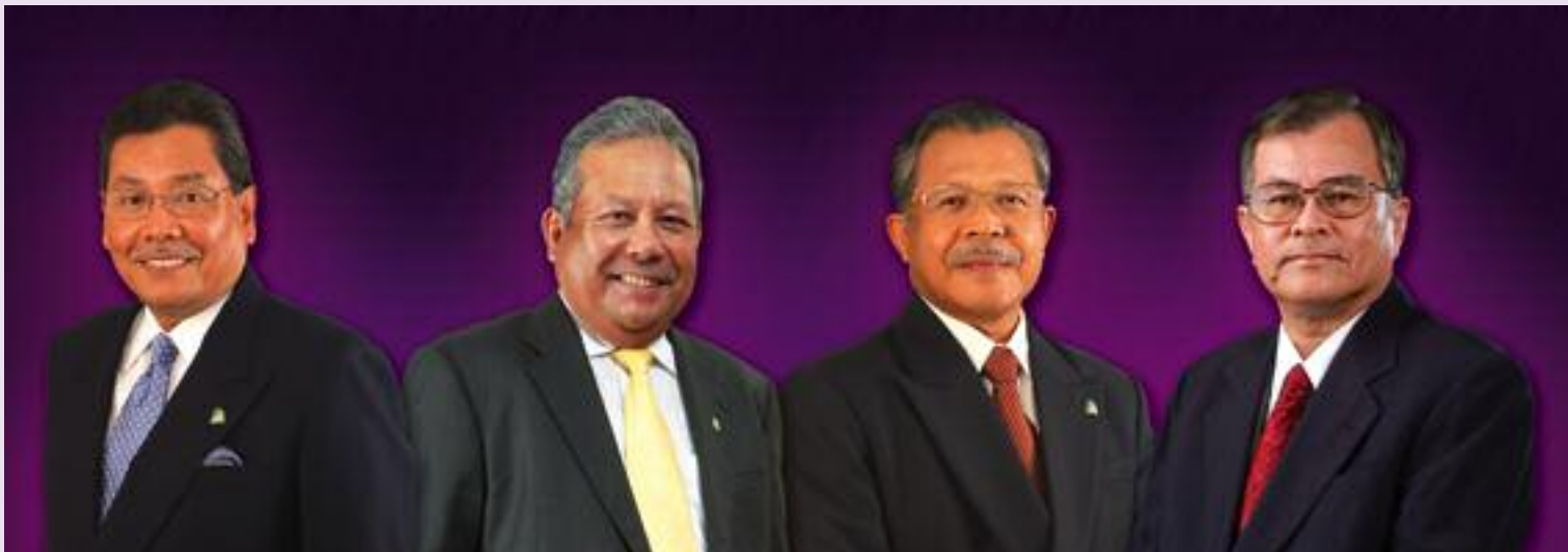
Dato' Syed Ariff Fadzillah Syed Awalluddin